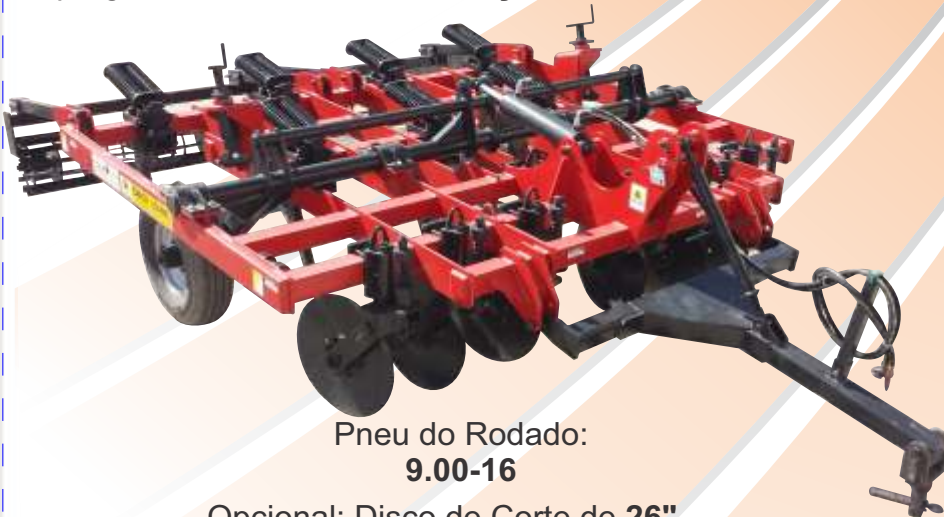
Pneu do Rodado: 9.00-16

O SPSI possui o Kit de pulverização para os modelos de 5 hastes, que ajudam no controle de pragas na lavoura da cana-de-açúcar.